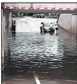
Überflutete Unterführung in Grieskirchen