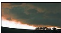
Ausgehend vom Innviertel zog am Samstagnachmittag die Gewitterfront durch Oberösterreich.